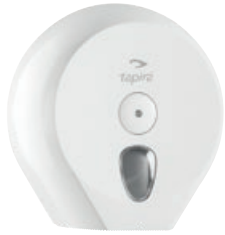
TAPIRA Jumborollenspende Midi weiß, Ø 23 cm 273/270/128 mm* Art.-Nr. 07730417