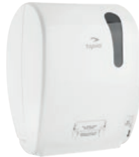
TAPIRA Rollenhandtuchspender Autocut 405/320/224 mm* Art.-Nr. 07730406