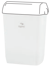
TAPIRA Abfallbehälter groß, 43 l 500/400/280 mm* Art.-Nr. 07730410