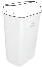
TAPIRA Abfallbehälter klein, 23 l 490/330/220 mm* Art.-Nr. 07730408