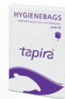
TAPIRA Hygienebags PE, weiß 30 St./Pkg. Art.-Nr. 07730025