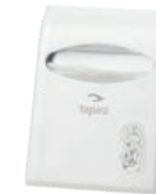
TAPIRA Toilettensitzauflagenspende 295/230/60 mm* Art.-Nr. 07730407