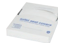
Toilettensitzauflagen Papier 200 St./Pkg. Art.-Nr. 07730028