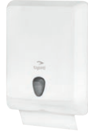
TAPIRA Handtuchspender groß 400/290/130 mm* Art.-Nr. 07730405