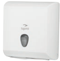
TAPIRA Handtuchspender klein 300/290/136 mm* Art.-Nr. 07730404