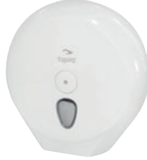
TAPIRA Jumborollenspende Maxi weiß, Ø 29 cm 335/335/128 mm* Art.-Nr. 07730418