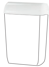
TAPIRA Deckel für Abfallbehälter groß, 43 l Art.-Nr. 07730411