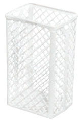
TAPIRA Abfallkorb Kunststoff 500/320/250 mm* Art.-Nr. 07730412