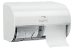
TAPIRA Doppelrollenspende Kleinrollen 150/260/150 mm* Art.-Nr. 07730413