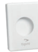
TAPIRA Hygienebeutelspende für Kunststoffbeutel 138/98/26 mm* Art.-Nr. 07730415